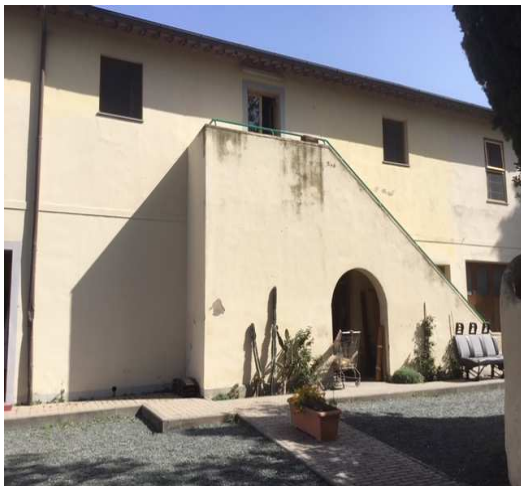
PROSPETTO SUD SCALA