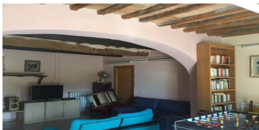
INTERNO P. T